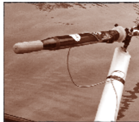
Sensoren am Skulls montiert

In der zweiten Messung haben wir zwei Trainings auf Rennfrequenz gemacht in zwei verschiedenen Booten. Dabei haben wir mittels der Bootssensoren insbesondere die Beschleunigung und Stabilität bei verschiedenen Schlagzahlen untersucht und zwischen den beiden Booten verglichen. Noch dauert die Auswertung der Sensoren länger als der Entscheid von Athleten und Trainer für das von der Firma Empacher uns zur Verfügung gestellte Boot. Doch das Ergebnis war erstaunlich eindeutig: Das Boot, das die Mannschaft schliesslich fuhr, war auf Renn-tempo stabiler und bewegte sich gleichmässiger, was im Nachhinein unsere Entscheidung unterstützte.