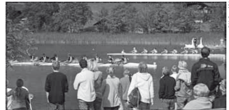
Vor dem Schlechtwetter-Abbruch: Zieleinlauf-Atmosphäre am Schwarzsee.

Trophy insgesamt CHF 3'800.– an Preisgeldern zur Verfügung. Die Regatta, die dann am 8. und 9. September stattfindet, sollten bereits jetzt die ambitionierten Doppelzweier in ihrem Terminkalender notieren. Der Freiburger Regattaverein freut sich, auch im September 2012 wieder viele junge Sportler auf dem Schwarzsee begrüßen zu dürfen. Auch dann werden wieder die Mix-Rennen oder das Race Eltern & Kid den Samstag prägen; wo sonst kann man einmal mit der Kollegin zusammen ein Rennen bestreiten. Jens Lischewski